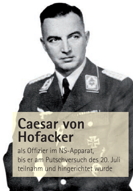
Caesar von Hofacker

Als am 20. Juli '44 dann zuerst die Meldung kam, Hitler sei beim Attentat getötet worden, haben wir in Paris plangemäß alles verhaftet. Als dann durchkam, dass Hitler lebte, hatten wir nicht den Mut und die Möglichkeiten, ihn und sein mörderisches Regime abzusetzen. Ich hatte es geahnt: Unsere Chancen standen 2 : 98. Wir alle wurden in Berlin von Freislers Schau-Gericht abgeurteilt. Mich ließen sie bis Dezember leben, dann erhängten sie mich. Wenn Menschen alle Rechte genommen werden, dann war das für mich nicht automatisch ein Problem, fürs erste. Nur fürs erste, natürlich.